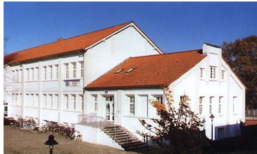
b.i.t., An der Kokenmühle 7, 49808 Lingen

Unsere Trainer und Dozenten verfügen über vielfältige Qualifikationen und Zertifikate, langjährige Erfahrung im IT-Bereich und in der Vermittlung des entsprechenden Know-How.